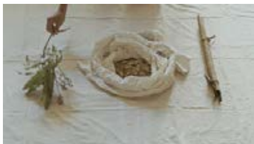
© Vandy Rattana, photogramme issue de la vidéo «Monologue»