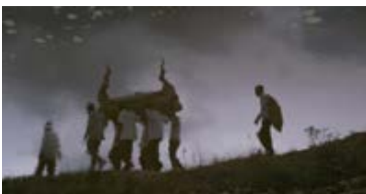
© Vandy Rattana, photogramme issue de la vidéo «Funérailles»