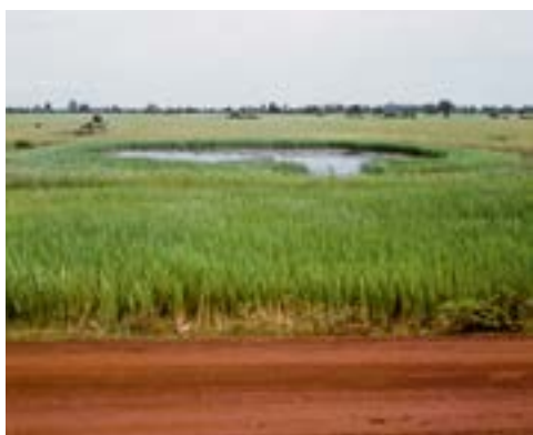
© Vandy Rattana, série Bomb Ponds

Tous les visuels de ce dossier sont à votre disposition par mail, sur demande. Ils sont libres de droit dans le cadre d'une annonce de l'exposition «Une mémoire jamais enfouie» de Vandy Rattana du 5 avril au 24 juin 2018. Le respect des œuvres des artistes est demandé et ces visuels ne doivent pas subir de recadrage lors de leurs reproductions.